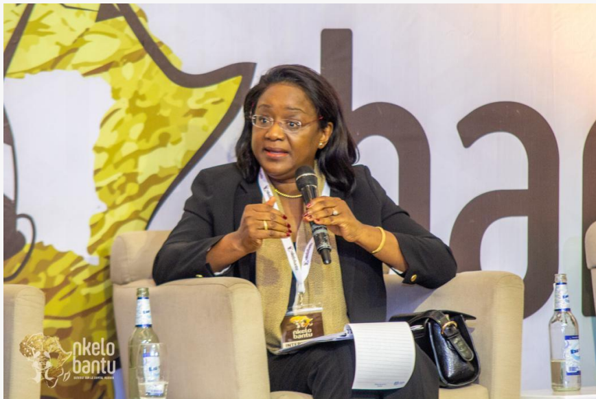
Nteba Soumano, directrice pays de l'Organisation internationale du travail (OIT),