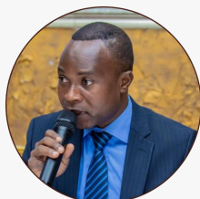
Gaby Kuba Président de l'Union Nationale de la Presse Congolaise (UNPC)