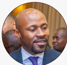
Patrick Muyaya Ministre de la Communication et Médias Porte-parole du gouvernement