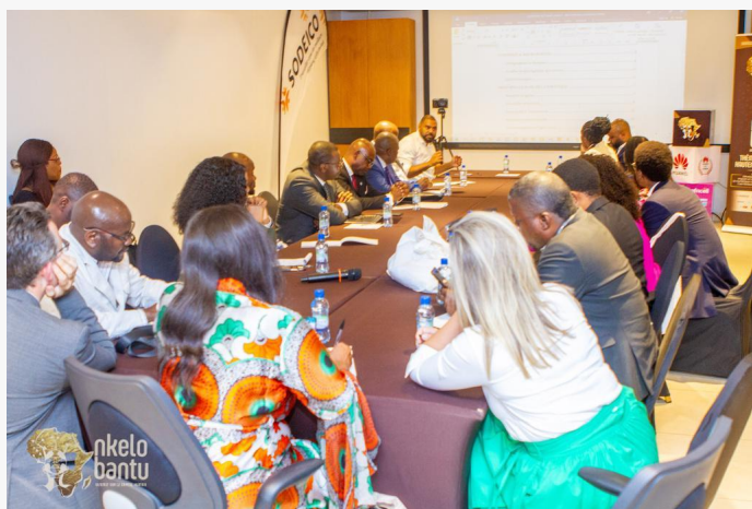
Table ronde Diaspora, Nkelo Bantu 2022

La table ronde diaspora avait pour objectif principal de continuer le travail initié lors de l'atelier Diaspora tenu durant la deuxième édition du forum Nkelo Bantu, notamment l'élaboration des grandes lignes d'un projet de proposition de loi diaspora. Ainsi, les points qui ont fait l'objet des discussions lors de cette table ronde étaient: (1) les questions de diversité en ce qui concerne la double nationalité et la diaspora, (2) l'identification des Congolais à l'étranger et (3) le besoin de créer des opportunités afin de pousser la diaspora à venir investir dans leur pays.