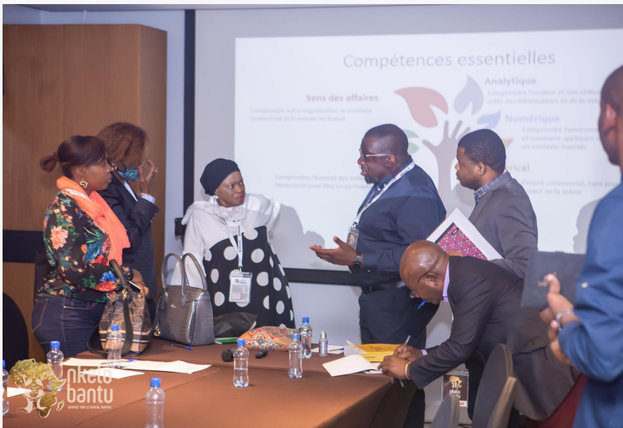
Formation RH, Jour 2, Nketo Bantu 2022

Cette formation avait pour but de ressortir la fonction des ressources humaines qui consiste à faire correspondre les emplois d'une organisation avec les compétences de ses employés. Cela implique de nombreuses tâches telles que la gestion des contrats, des fiches de paie, le recrutement et le développement des compétences individuelles et collectives. Les ressources humaines sont considérées comme le capital humain de l'entreprise. La bonne relation entre employeur et employés a été retenue comme un critère fondamental dans ce domaine.